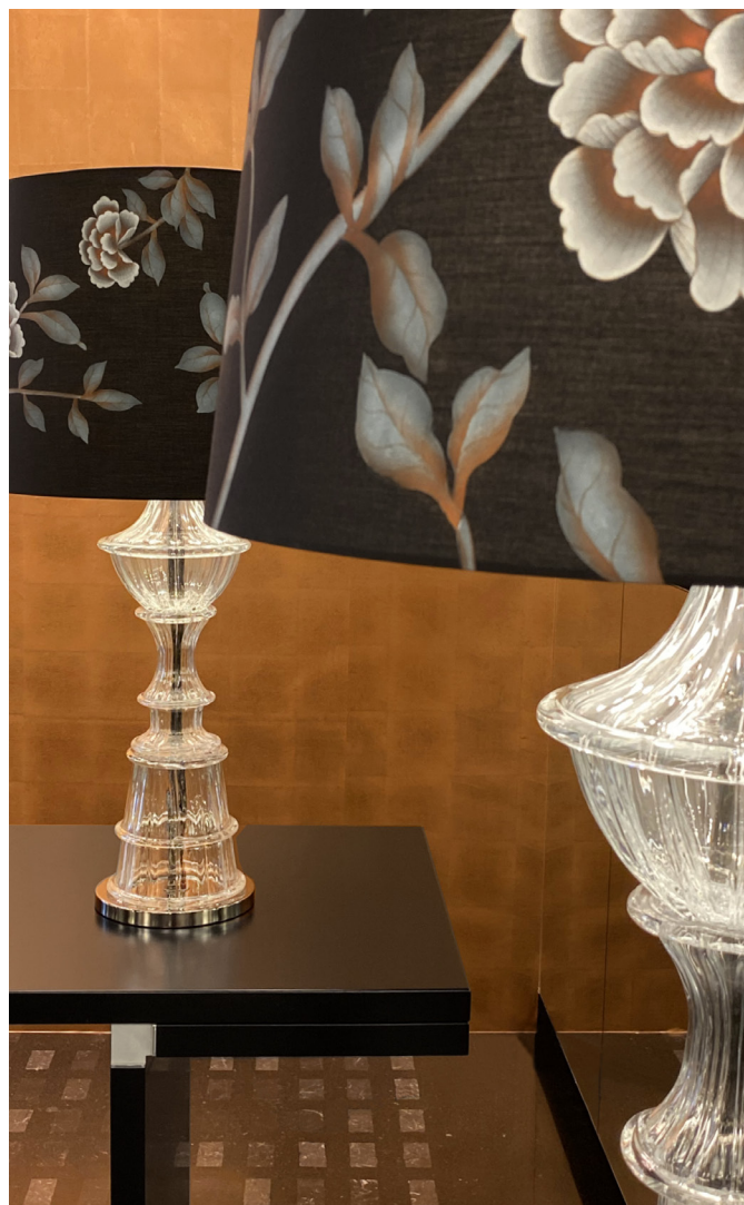
ТЕКСТ: СЕРГЕЙ НЕЧАЕВ, ФОТО ПРЕДОСТАВЛЕНЫ ПРЕСС-СЛУЖБАМИ

Легендарный бренд светильников из муранского стекла Barovier & Toso открыл в Милане обновленный шоурум. Концепцию помещения разработал интерьерный бренд Misha. Стилистика ар-деко, предложенная дизайнерами, возникает на стыке европейской и ориентальной традиций. Стекло ручной работы Barovier & Toso обретает новое эстетическое звучание на фоне написанных вручную по китайскому шелку пионов.